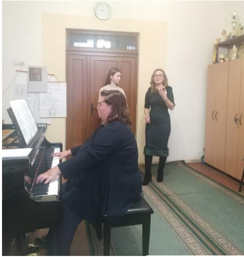
Швах-Пекар М.І. Динамічні відтінки та фразування у вокальних творах.