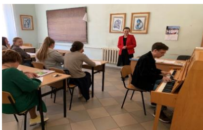
Пришляк Н.І. Модуляція у споріднені тональності