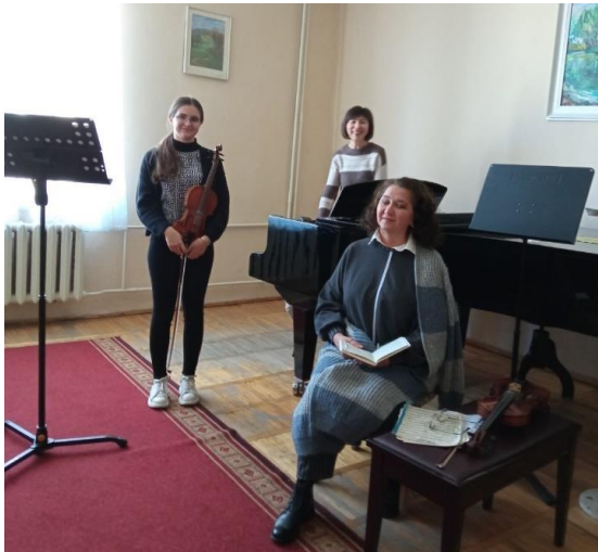
Томич М.В. Робота над стильовими особливостями у творах віденських класиків на прикладі Концерту №3 В.А.Моцарта