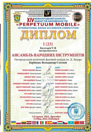
Комунальний заклад «Ужгородський музичний фаховий коледж імені Д.Є.Задора» Закарпатської обласної ради