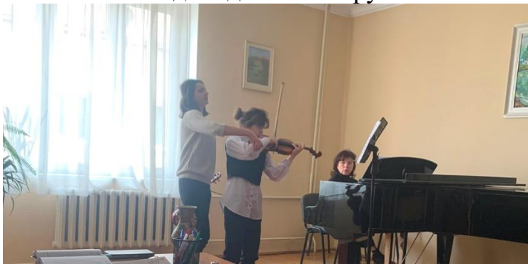
Томаш М.Ф. Робота над художнім образом у процесі вивчення музичного твору