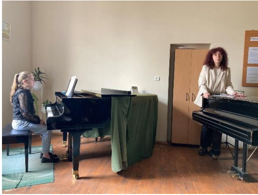
Коцан О.М. Формування поліфонічного мислення студентів спеціалізації «Хорове диригування» в процесі вивчення інвенцій Й.С. Баха