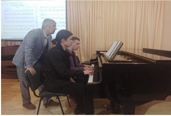
Скороход В.Л. Основні методи інструментування для духового оркестру