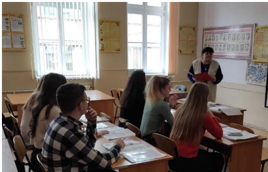
Степанова М.В. Outstanding people of Ukraine. M.V.Lysenko is a prominent Ukrainian composer. Pages of biography and the creativity