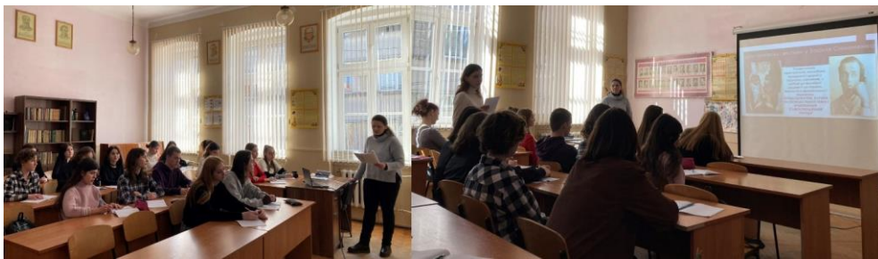
Яковлева В.Б. Нова хвиля відродження української літератури на початку 1960-х років. «Шістдесятництво» як явище культурологічне й соціальне, його зв'язок з дисидентським рухом.