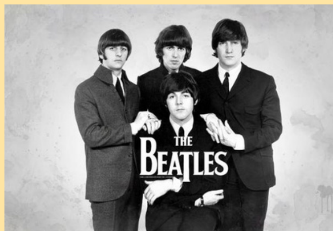
Британський гурт «The Beatles»

настроями поціновувачів музики. І хоч мистецтво створюється не з метою пропаганди, задум автора і трактування його загалом можуть суттєво відрізнятись. Наведу близький до нашого часу приклад, коли культовий британський рок-гурт «The Beatles» позиціонував себе аполітичним колективом, але тогочасне суспільство сприймало його як символ соціальних змін.