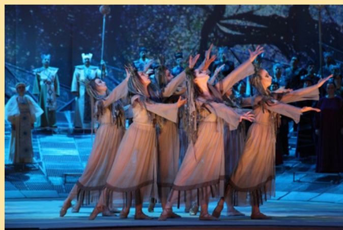
Кадр з прем'єри фольк-опери «Коли цвіте папороть»

Одним з найвідоміших творів композитора є фольк-опера «Коли цвіте папороть», написана за мотивами гоголівських творів, котра була заборонена радянською владою майже перед призначеною прем'єрою у 1978 році. Декорації та костюми до постановки твору були знищені. Український письменник та громадський діяч Максим Стріха зазначає, що заборона опери припала на епоху «задушеного десятиліття» й перебування на посаді секретаря ЦК КПУ з ідеології Валентина Маланчука – людини, що «патологічно ненавидить українську культуру і її представників». Тож прем'єра на оперній сцені відбулася лише у 2017 році, майже за 40 років після запланованої дати.