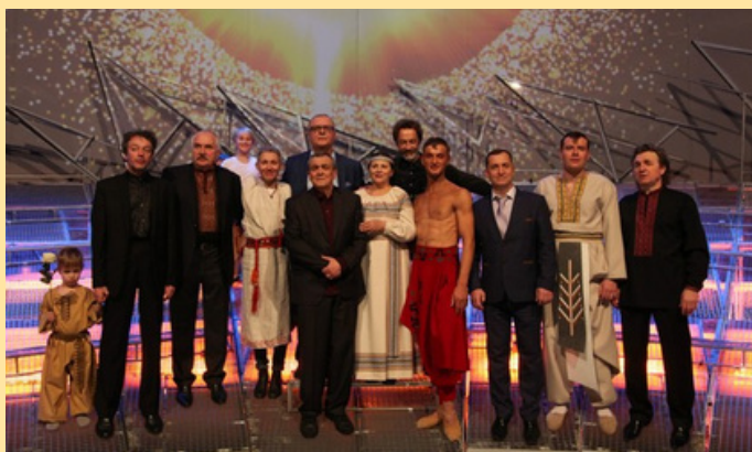
Солісти і постановники вистави

До феєрії були залучені 400 учасників. Прем'єру присвятили покійному Євгену Лисику, що був сценографом забороненої постановки. Твір є яскравим прикладом неофольклоризму в оперному жанрі і безперечно у багатьох відношеннях його позначено новаторством для українського музичного театру. Композитор відмовляється в своєму творі від звичних оперних форм, орієнтується на специфіку народних хорових колективів, позбавляє оперу фабульності.