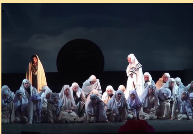
«Набукко». Хор полонених євреїв

Дж.Верді та Р.Вагнера. Усе це обумовлене актуальністю творчості митців для своїх співгромадян. До прикладу, хор полонених євреїв з опери Дж.Верді «Набукко» став своєрідним заклик до єднання в італійському перед-революційному суспільстві